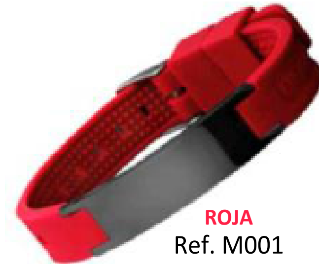
ROJA Ref. M001