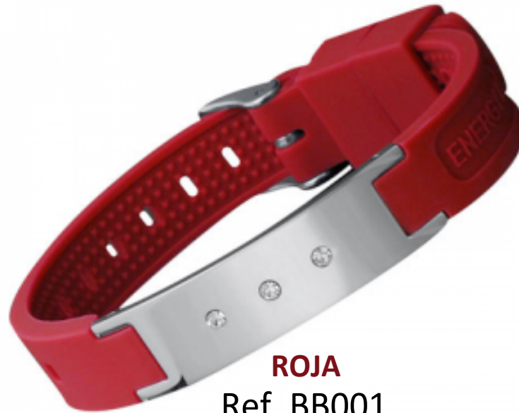
ROJA Ref. BB001