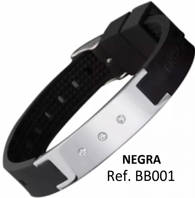
NEGRA Ref. BB001