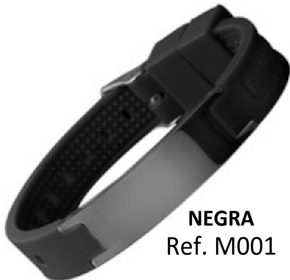
NEGRA Ref. M001